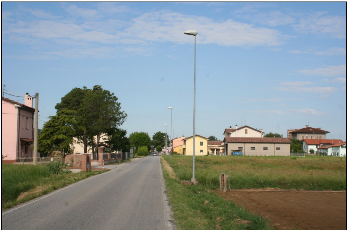
FOTO 2: via Boscabella direz. ovest– sul lato destro porzione dello stralcio n.1