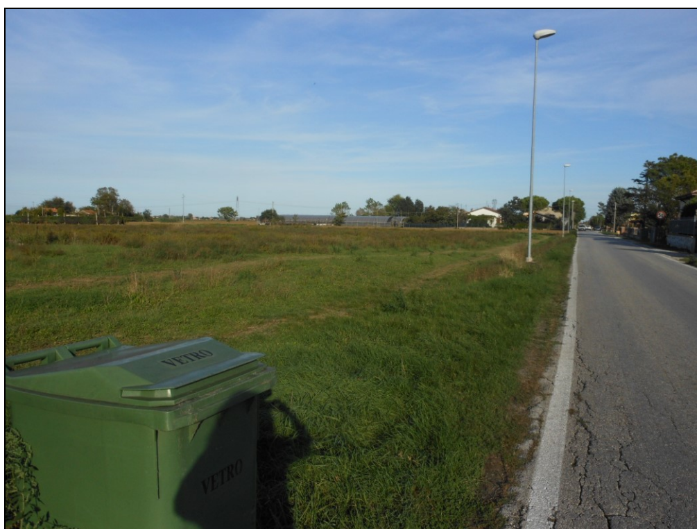
FOTO 4: via Boscabella direz. est – sul lato sinistro stralcio n.1